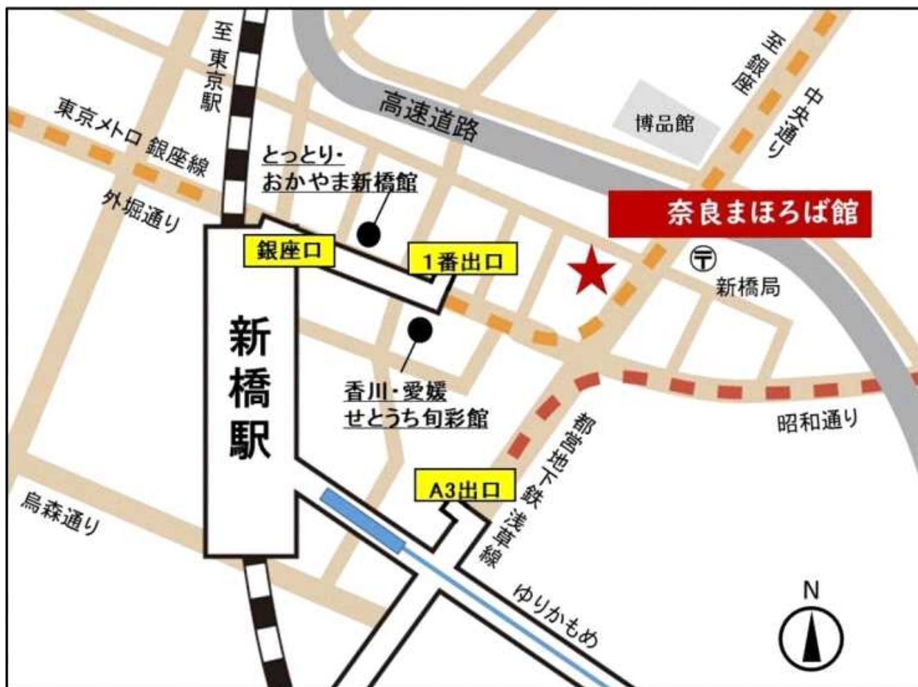
○選考会場の位置図