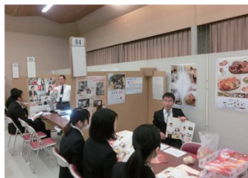
合同企業説明会(奈良県文化会館)