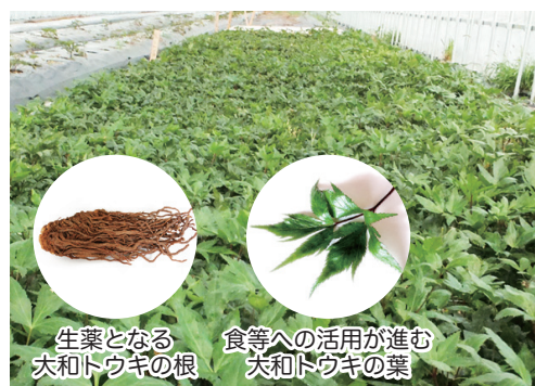
生薬となる 大和トウキの根