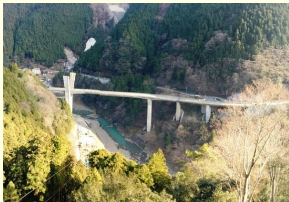
国道168号辻堂バイパス夢翔大橋 （平成30年3月開通予定）