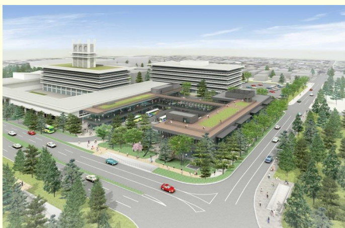
（仮称）登大路バスターミナル（イメージ）