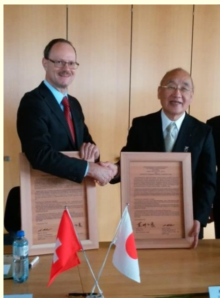
スイス・リース林業教育センターとの覚書の締結

スイス・リース林業教育センターの実習生受け入れ、ベルン州でのサマースクールへ奈良県団を派遣、スギ・ヒノキ斉林から多様な樹種・林齢の森林への誘導パイロット事業の実施