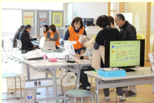
王寺健康ステーション