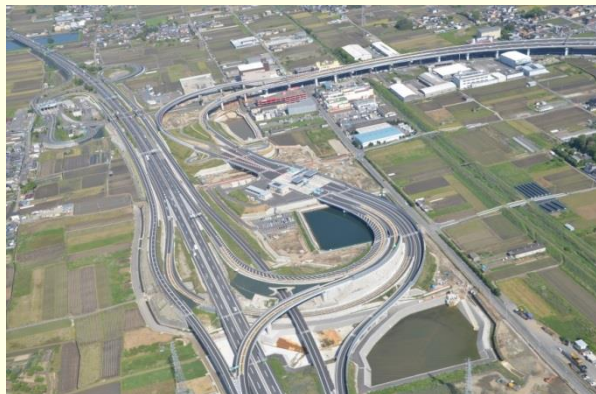
企業立地の魅力が高まる郡山下ツ道ジャンクション