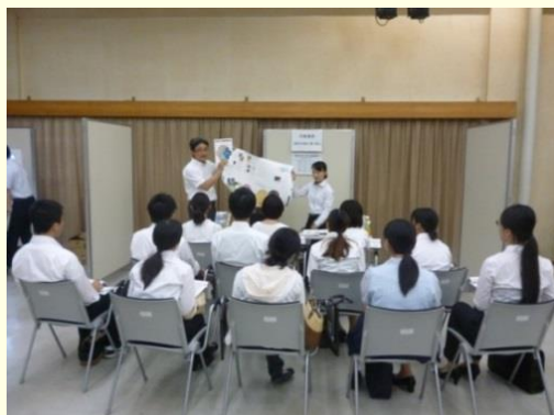
就職活動準備セミナー