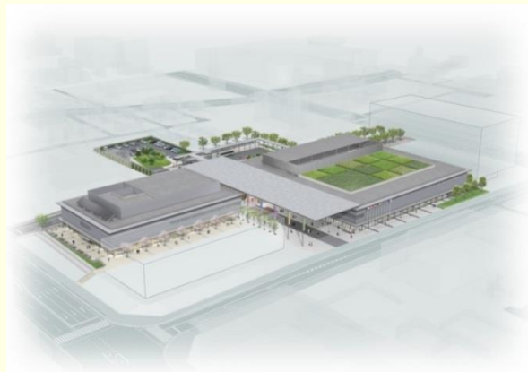
大宮通り新ホテル・交流拠点(イメージ)