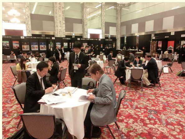
奈良県観光キャンペーン 商談会

南部東部地域及び 新 大和高原北部地域への宿泊観光客を対象としてキャンペーンを実施