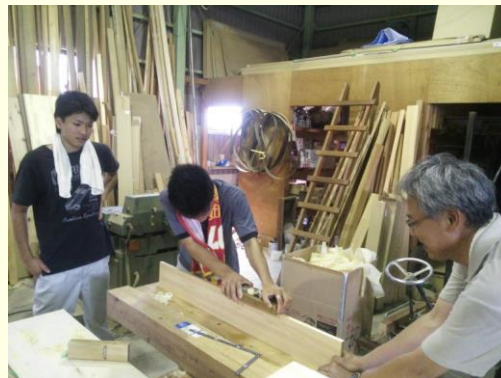
木材加工場でのインターンシップ（奈良朱雀高校）