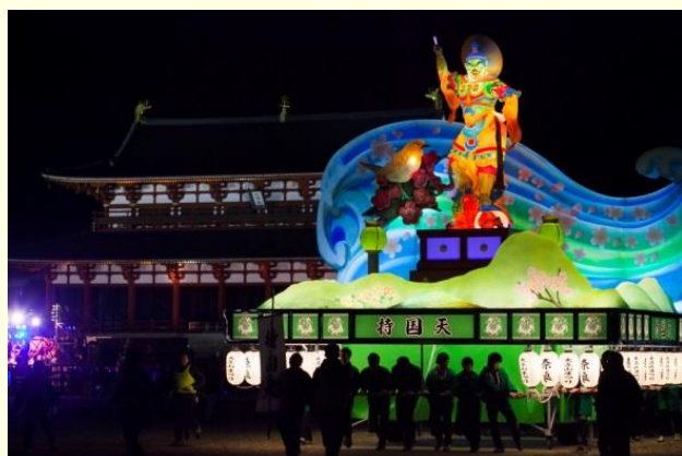
奈良大立山まつり