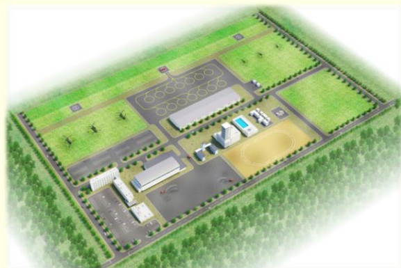
県広域防災拠点(イメージ)