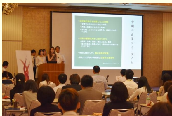
東アジア・サマースクール2016