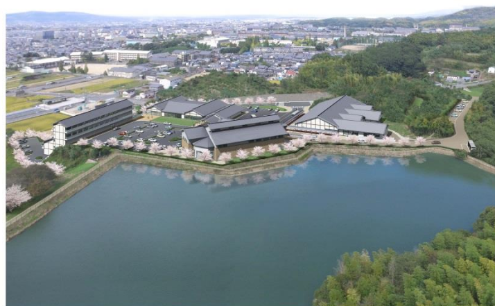
(仮称)奈良県国際芸術家村（イメージ）