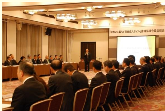
「きれいに暮らす奈良県スタイル」推進協議会設立総会