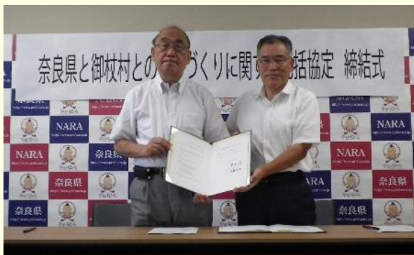
市町村とのまちづくり包括協定の締結

人権啓発イベントの開催・人材養成、隣保館運営等補助、①性的少数者など新たな人権課題に対する啓発、②人権に関する県民意識調査等