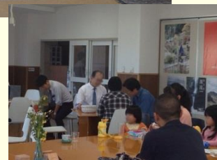
奥大和移住定住交流センター「engawa」