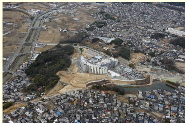
建設中の新奈良県総合医療センター（平成30年春開院予定）