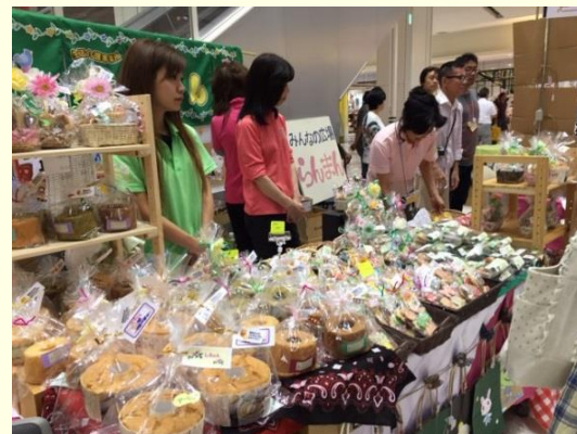
働く障害者応援フェア