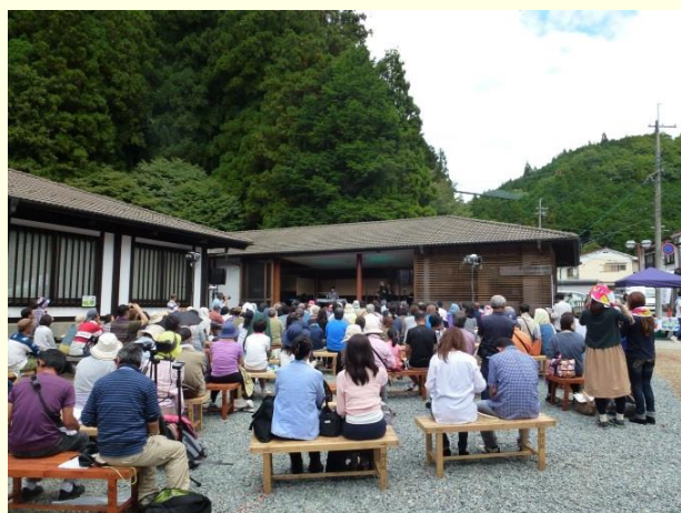
えんがわ音楽祭（天川村洞川）

奥大和移住定住交流センターの運営、ホームページ等による交流情報発信や交流イベントの開催等