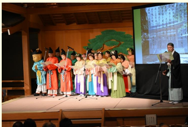
記紀・万葉プロジェクト「古事記のまつり」