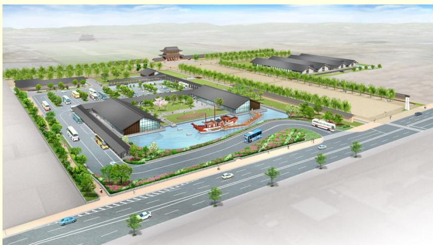
平城宮跡歴史公園朱雀大路西側地区（イメージ）

（仮称）登大路バスターミナルの整備推進、「ぐるっとバス」の運行充実、大宮通りの修景植栽整備等