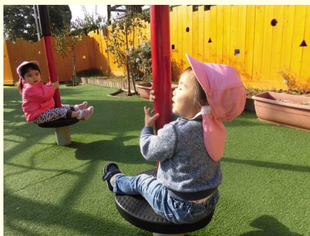
元気に遊ぶ子どもたち（片岡の里保育園）