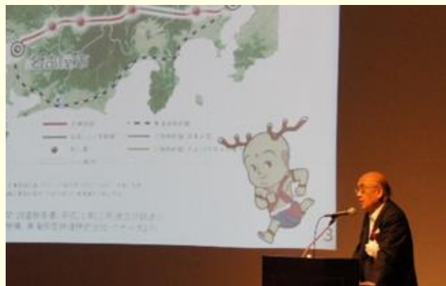
企業立地セミナー in 東京