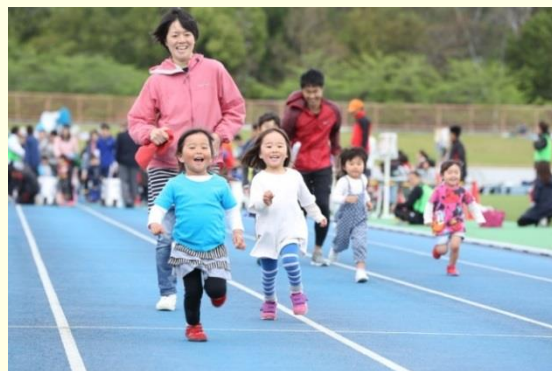
総合型地域スポーツクラブ交流大会 [50mダッシュ王選手権]