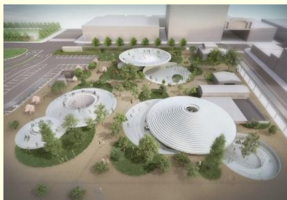
天理駅前広場整備の完成イメージ