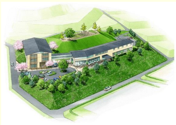
NAFIC附属セミナーハウス（イメージ図）