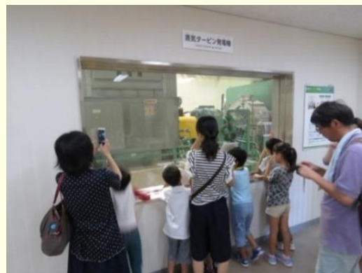
次世代エネルギーパーク見学バスツアー （クリーンセンターかしはらの廃棄物処理熱利用発電設備）