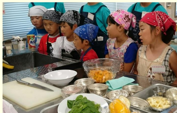
地域栄養カレッジ