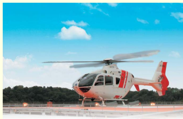
平成29年に導入予定のドクターヘリ（イメージ）