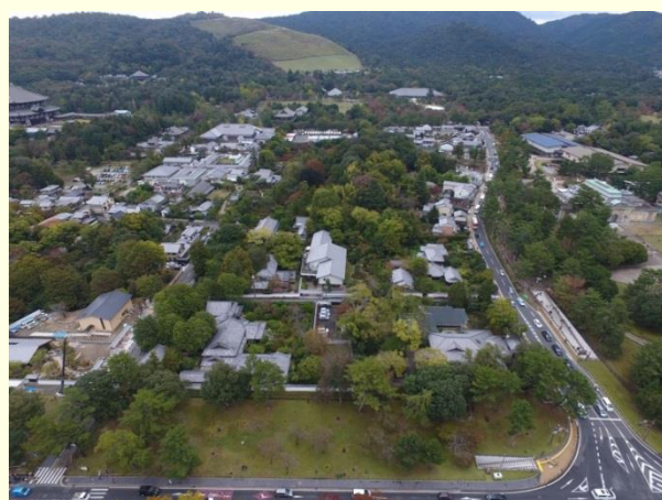
吉城園周辺地区の全景（現状の空撮）