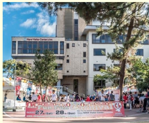
奈良県外国人観光客交流館