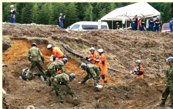
近畿府県合同防災訓練(五條市)