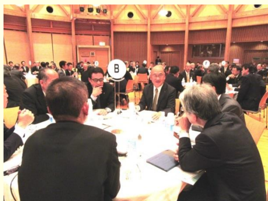
奈良県教育サミット