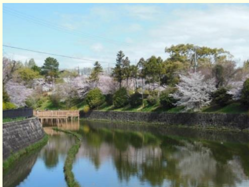
「なら四季彩の庭」づくり（大和郡山市 郡山城趾周辺）