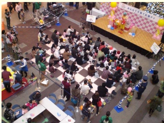
なら子育て応援団広報・啓発イベント「みんなで子育て応援デイ」

新 女性活躍の気運醸成のためのトップフォーラムの開催、 新 女性活躍企業等の優良事例を紹介する管理職・人事担当者向けセミナーの開催、女性活躍促進会議の開催等