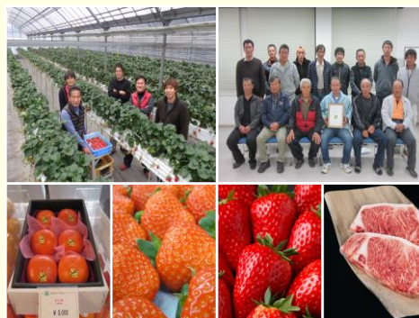
県産農畜水産物のブランド認証制度 認証団体と認証品目