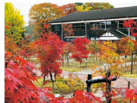
奈良カエデの郷「ひらら」