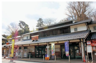
道の駅「宇陀路大宇陀」