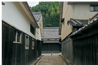
宇陀市松山 重要伝統的建造物群保存地区