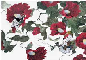
「心音 夢の音色」(部分) ©中島潔

鮮やかで温かみのある色彩で子どもや女性の姿を描いてきた佐賀県出身の画家 中島潔。故郷の情景を描いた作品のほか、東日本大震災を経て制作された新作「新しい風」シリーズなどを公開します。