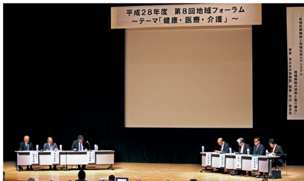
第8回では、大和高田市長、御所市長、香芝市長、葛城市長、広陵町長が参加されました

当日は、済生会中和病院の今川敦史院長による基調講演に引き続き、知事からテーマについての現状や県の取り組みについての説明を行い、その後、市長・町長を交えてのパネルディスカッ