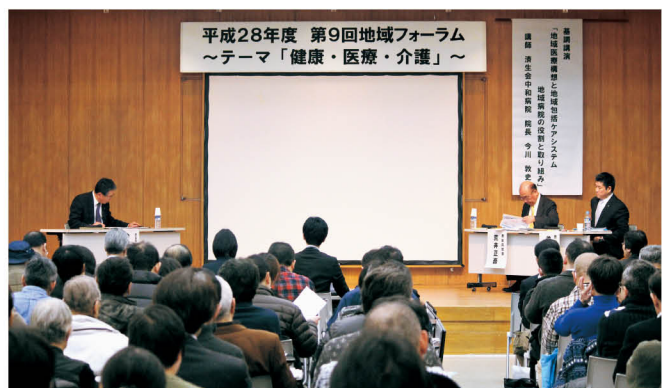
第9回では、奈良市長が参加されました

ションを行いました。パネルディスカッションでは、各市長・町長から、県内大学と連携した介護予防リーダーの養成、データに基づく健診受診の啓発活動などの取り組みが発表されたあと、健康教室などへの住民の参加意欲を今後どのように高めていくかなどの地域の課題についても意見が交わされました。