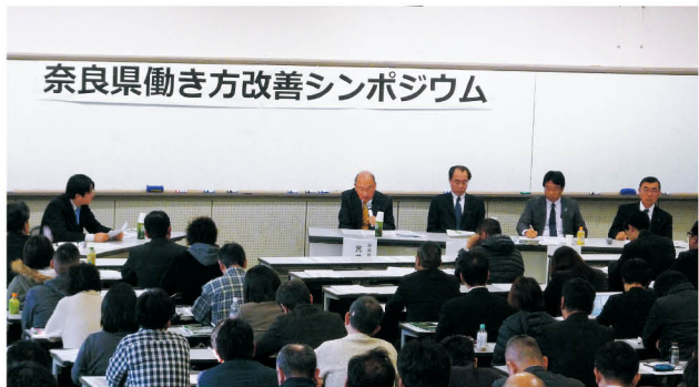
パネルディスカッションの様子

などの意見が交わされました。会場からは、「働き方改善は、日本の構造的な問題の解決につながるということが分かった」、「県内では中小企業が多いので、特に労働条件が大事になってくる。ぜひ具体的な政策に結び付けてほしい」、「仕事のやり方を見直す必要性を感じた」といった発言があり、働き方改善の意義と取り組みの重要性を認識するシンポジウムとなりました。