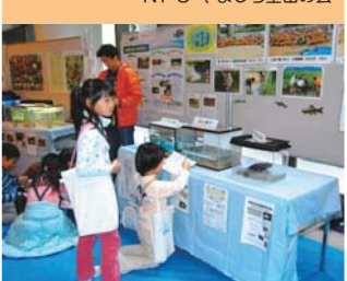
○淀川で採れる自然素材を使って工作 (財)河川環境管理財団 大阪事務所