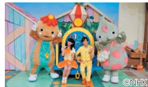
NHK BSプレミアム おとうさんといっしょ 出張レオてつコンサート