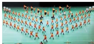
京都橘高校マーチングバンド