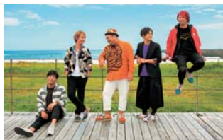
ジャーパーボンズ