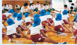
幼稚園での体育指導補助

競技の練習だけでなく、スポーツを総合的に学ぶことができます。実習などで他の高校とちがう経験ができるので、将来に生かせればと思っています。