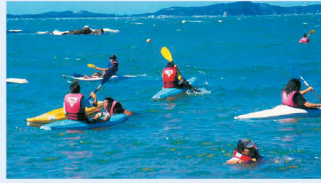
マリンスポーツ実習