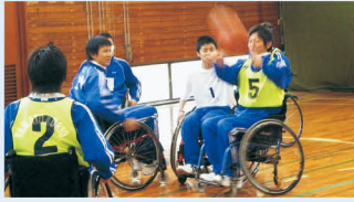
身体障害者スポーツ体験

アスリートやスポーツ指導者としての能力を伸ばし、心身ともに健全なひとづくりを目指す学科です。特色ある全25単位の専門科目のほか、身体障害者スポーツ体験や救命法の講習、マリンスポーツ実習なども受けられます。