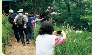
ササユリの観察会