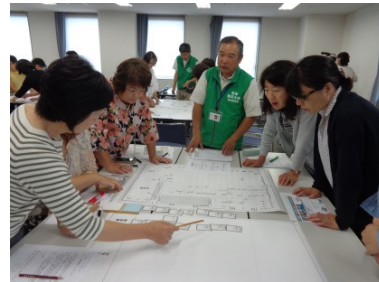
《研修会の様子 (HUG 避難所 運営ゲーム)》