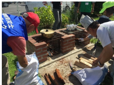
《講座の様子 (防災かまどベンチ でご飯炊き)》