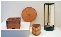
モノとくらしのデザイン —かたち—