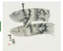
神莫山「土」制作年不詳 三重県立美術館蔵

奈良とゆかりの深い書家 神莫山と紫舟の 独自の作品から、書の芸術性や魅力を感じてみませんか。