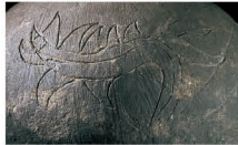
龍/池上曾根遺跡