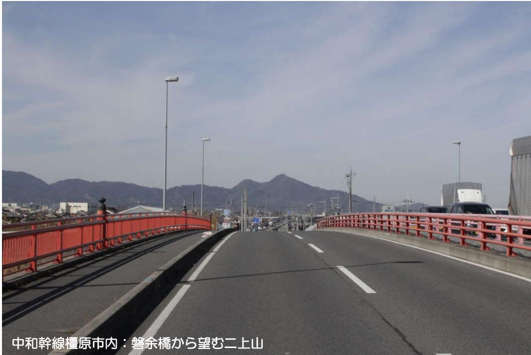
中和幹線橿原市内：磐余橋から望む二上山