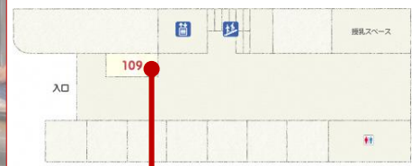
チャレンジショップ