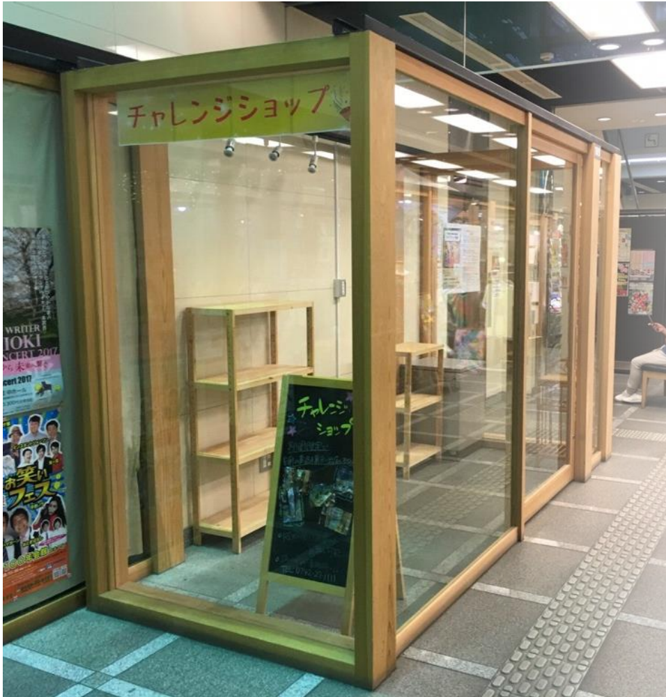
ショップスペース (約 6.84 m 2 )