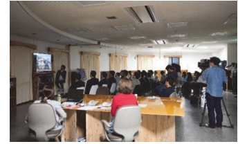
奥大和移住定住交流センター「engawa」

魅力的な観光資源づくりや、情報発信の強化、多様なイベントの開催、仕事の確保や医療・福祉、教育等の充実、災害への備え等を進め、南部地域・東部地域を「頻りに訪れてもらえる、住み続けられる」地域にします。