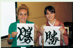
書道パフォーマンスによる交流