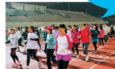
ナイトランのようす