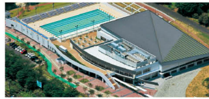
まほろば健康パーク(大和郡山市)

年中利用できる温水プールをはじめ、トレーニングやヨガ等の教室が行われるフィットネススタジオなど充実の施設がそろっています。