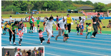
県内で64クラブが活動中です。(10月1日時点)

年齢や性別に関係なく、誰でも気軽にスポーツを楽しめます。健康づくりのための運動から本格的なクラブチームまで、自分に合ったものを選んでみませんか。