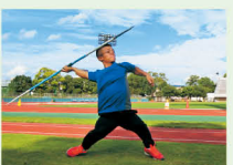
陸上の参加者がやり投げで日本記録を樹立するなど日本のトップレベルで活躍しています。

障害者アスリートの活躍は障害の有無に関わらず、誰もがスポーツに取り組むきっかけになります。県ではパラリンピックなどで活躍できる選手の輩出を目指し、陸上・水泳の2競技で有望選手の発掘・育成を行っています。