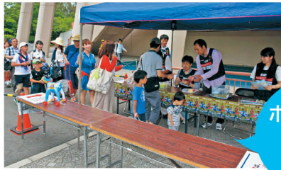
入場受付のボランティア