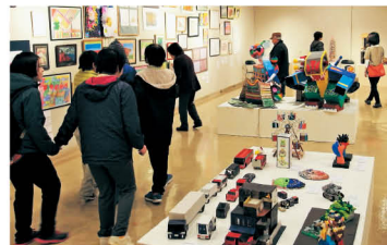
第16回全国障害者芸術・文化祭あいち大会のようす

全国から募集した障害のある人のアート作品を、ビッグ幡部門・体感部門・自由部門の3部門に分けて展示。45回目を迎える奈良県障害者作品展もぜひ。