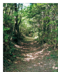
木漏れ日さす車坂古道

【受付】吉野口駅 【コース】吉野口駅→保久良古墳→今木甲神社→泉徳寺(今木権現堂)→車坂古道→石塚遺跡→大淀町役場(約7.5km)