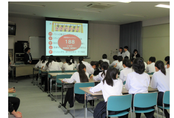
県内中学校での移動講座（H28年5月） 「消費者トラブルに巻き込まれないために」