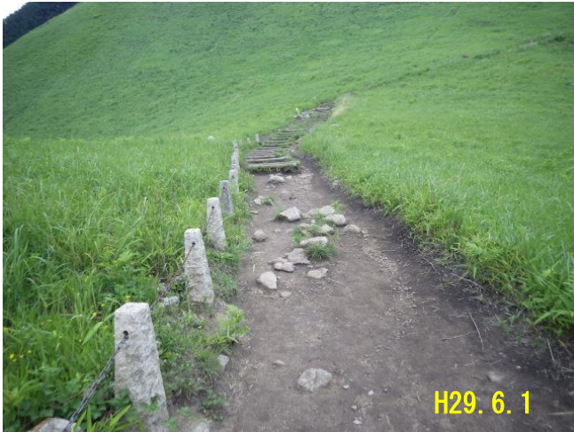
室生赤目青山国定公園 [宇陀郡曾爾村大字太郎路] 曾爾高原歩道(修復)