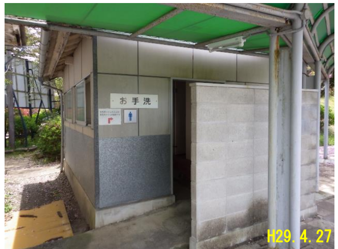
金剛生駒紀泉国定公園 [生駒郡三郷町信貴山] 信貴山東公衆トイレ(建替)