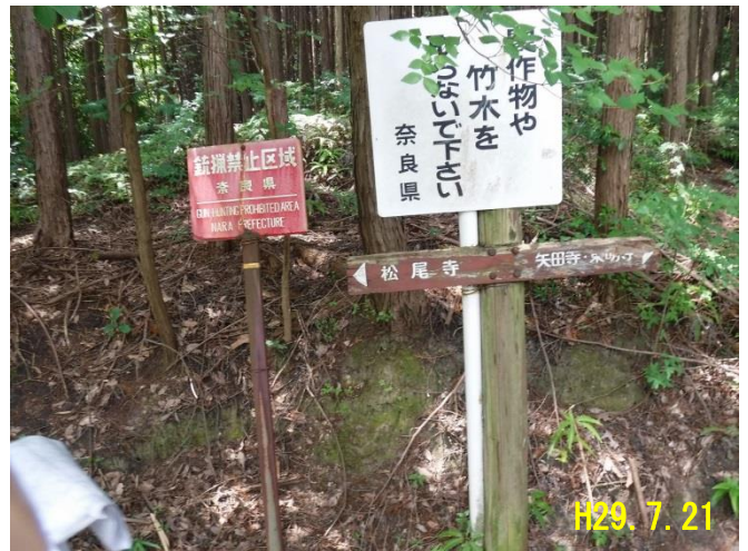
近畿自然歩道 [大和郡山市矢田町] 矢田丘陵歩道(標識再整備)