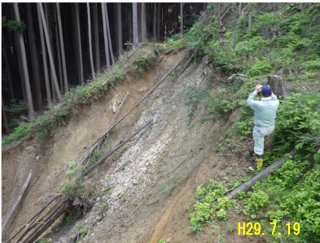
近畿自然歩道 [吉野郡東吉野村大字杉谷] 高見山登山道(修復)