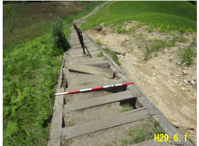
室生赤目青山国定公園 [宇陀郡曾爾村大字太郎路] 曾爾高原歩道(修復)