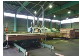
川上～川下の様々な取組を支援