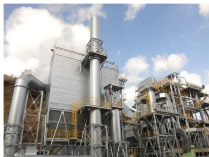
木質バイオマス発電施設