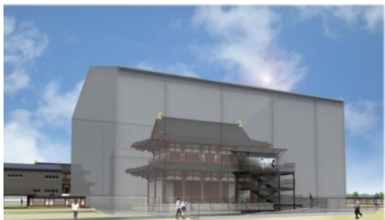
第一次大極殿・南門素屋根イメージ