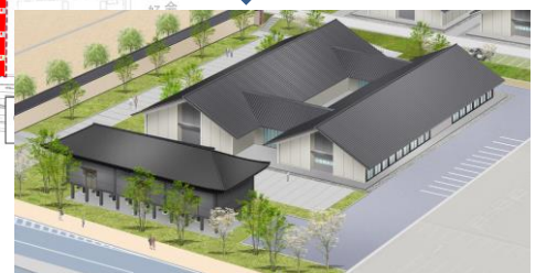
東側地区イメージ