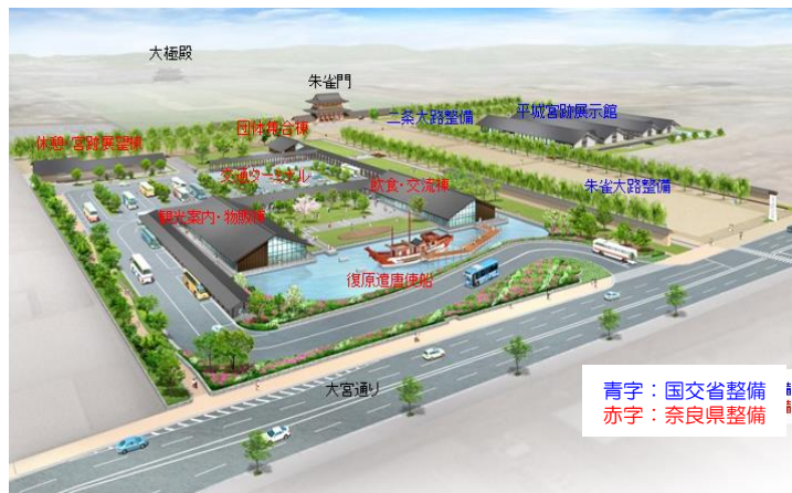
平城宮跡歴史公園拠点ゾーンイメージ