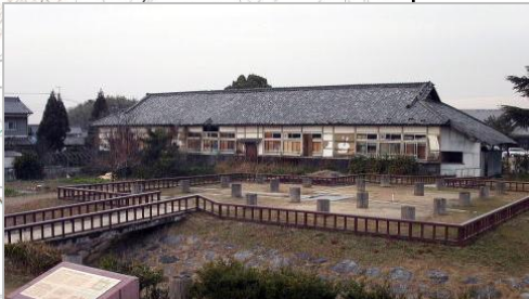
史跡 飛鳥水落遺跡