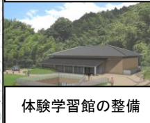
体験学習館の整備