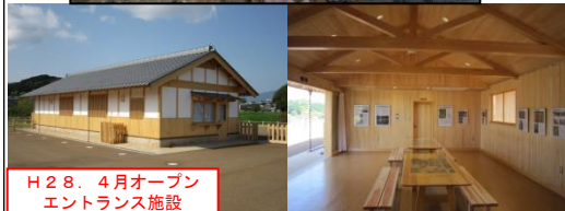
H28. 4月オープン エントランス施設