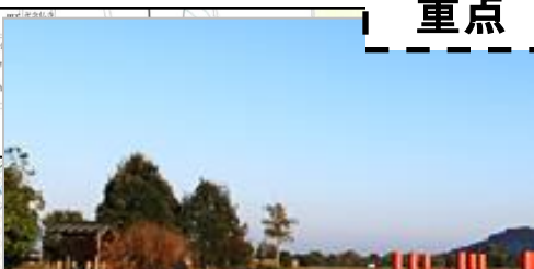
特別史跡藤原宮跡