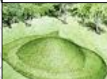
キトラ古墳の整備