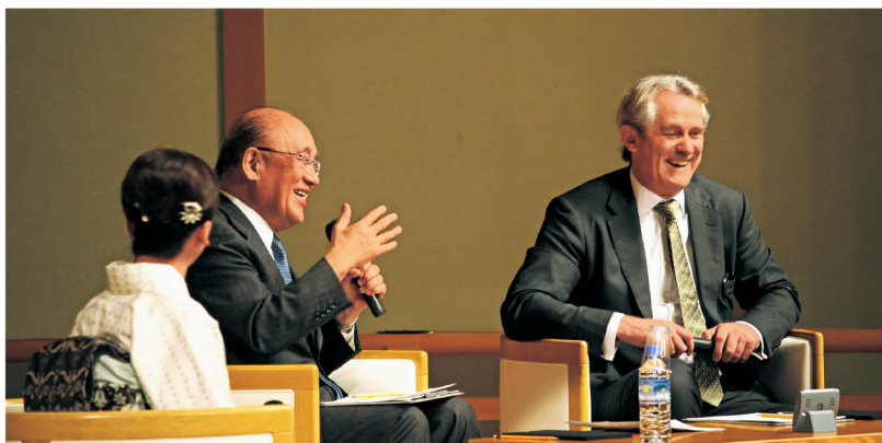
トークセッションのようす

第2部の荒井正吾奈良県知事とのトークセッションでは、自然や文化財などの資源を活用した付加価値の高め方や、日本人の働き方改革などについて発言があり、とりわけ日本における経営者・リーダーの経営戦略や役割などについて、活発な意見が交わされました。