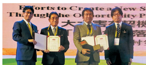
銀川市で行われた受賞式のようす