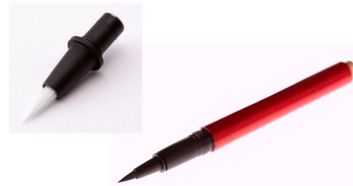
極細アイライナー