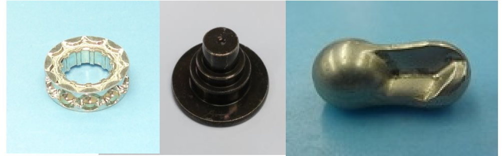
シートベルト部品 エアバック部品 等