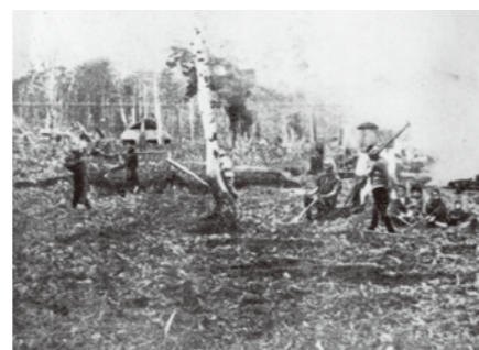
開墾する様子。作業は困難を極めた。 (明治23年 北海道 新十津川町)