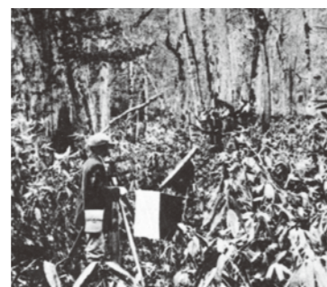
原生林を測量し、区画割が行われた。 (明治23年 北海道 新十津川町)