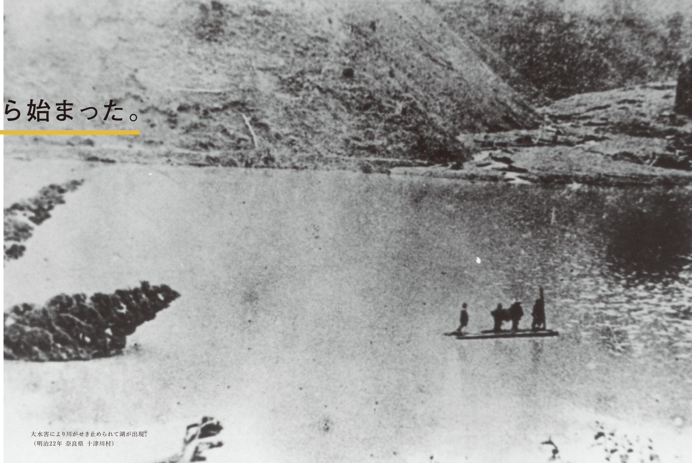
大水害により川がせき止められて湖が出現。 (明治22年 奈良県 十津川村)