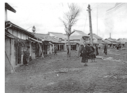
大正時代の街の様子。 (明治23年 北海道 新十津川町)