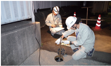
県営水道からの直結配水を開始(川西町)

磯城郡での水道事業の広域化 3町の浄水施設等更新費の削減(試算) 110億円 → 43億円