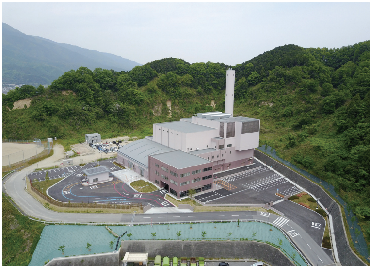
やまとクリーンパーク(やまと広域環境衛生事務組合)(平成29年6月完成)