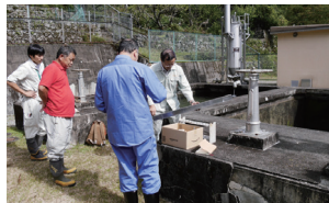
簡易水道技術支援の実施