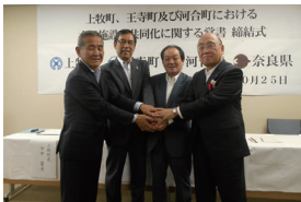
上牧町、王寺町及び河合町における水道施設共同化に関する覚書締結式

磯城郡での水道事業の広域化 3町の浄水施設等更新費の削減(試算) 110億円 → 43億円