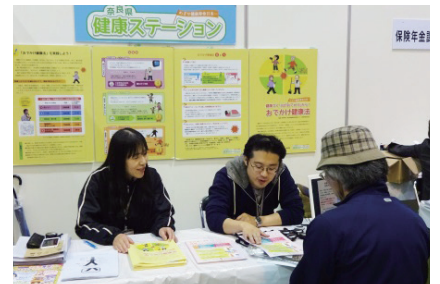
出張型健康ステーション(宇陀市)