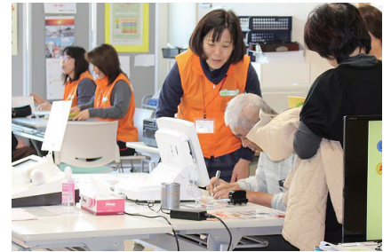
奈良県健康ステーション(王寺)