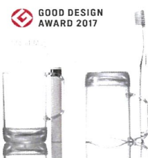
GOOD DESIGN AWARD 2017

国内での自社ブランドが浸透してきたこともあり、海外でも通用する製品に育てたいという思いの中、平成18年から輸出を開始。海外展示会の出展によるマーケティングで、デザイン性の高い新製品を開発し、海外に通用するものづくりを展開している