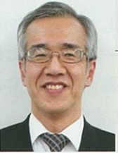
松谷コーディネーター メーカー OB 中小企業診断士

メーカー営業、会計事務所系コンサル、繊維問屋の経営管理に従事後、中小企業診断士として独立。後継者養成、事業計画策定、キャッシュフロー経営のお手伝いを致します。