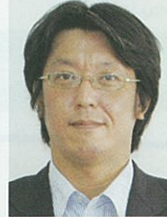
清水コーディネーター 卸販売 OB 中小企業診断士

金融機関勤務後、中小企業診断士、社会保険労務士として独立。経営改善、業務改善に取り組むほか、企業の組織活性化や人事労務の課題にも向き合います。