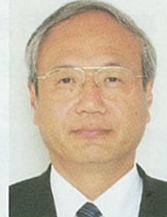
松浪コーディネーター メーカー OB ものづくり革新

30年間メーカーにて商品の企画・開発から製造まで担当。中小企業診断士として独立。事業戦略、商品開発、創業支援等、幅広いニーズに親身に対応させていただきます。