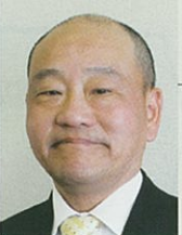
中井コーディネーター メーカー OB 中小企業診断士

中小企業診断士として独立後は、創業、施策活用、事業再生等においては幅広い支援実績があります。ご相談者の思いを感じとり、経営相談を親身にサポート致します。