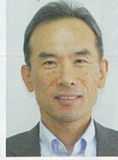
守口コーディネーター メーカー OB IT推進/事務局兼任

銀行、整理回収機構、日本政策金融公庫で勤務経験があり、ベンチャーから事業再生、1次産業から6次産業まで幅広い分野で経営改善のアドバイスが対応可能です。