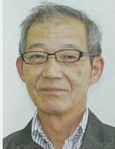
中川コーディネーター メーカー OB 製造革新

電機メーカー出身。専門分野においては、ものづくりを中心に、生産革新、「工場まるごと体質改善」に向けた数多くの対応実績を以て支援させていただきます。