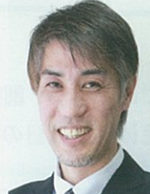
湯川コーディネーター 宿泊業 OB 中小企業診断士

金融機関で法人営業、事業再生、財務改善、震災復興支援等に従事。これまでのノウハウ・経験を生かして奈良の地元企業に還元するため、全力で支援してまいります。