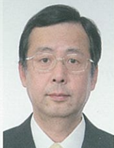
香川コーディネーター メーカー OB 中小企業診断士

メーカー出身。種々の新事業、新商品立上げ業務を経験。中小企業支援機関での支援経験も活かし、新サービス、新商品開発や事業展開、業務改革をサポート致します。