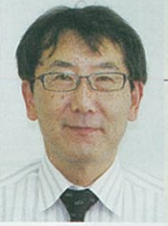
土本サブチーフコーディネーター 金融 OB 経営改善/事務責任者

銀行、整理回収機構、日本政策金融公庫で勤務経験があり、ベンチャーから事業再生、1次産業から6次産業まで幅広い分野で経営改善のアドバイスが対応可能です。