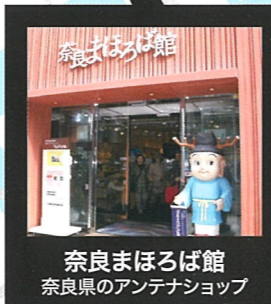
奈良まほろば館 奈良県のアンテナショップ