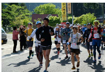
【D to K】洞川（天川村）スタート時