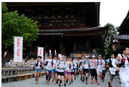
【K to K】金峯山寺（吉野町）スタート時