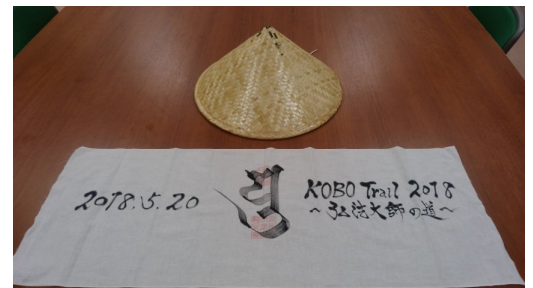
手ぬぐい・笠(天川村)