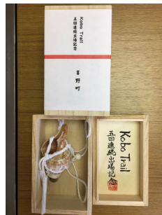
ミニホラ貝(吉野町)