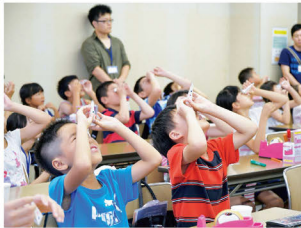
万華鏡を使って光の勉強

「だれでも先生」「だれでも生徒」を合言葉に、市民の皆さんが1日限りの先生となって楽しい授業を提供しあう街の学校「IKOMAサマーセミナー」を今年も開催します。