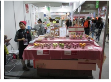
味間いもの甘煮仕上げ真空パックと試食販売