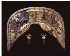
藤ノ木古墳出土鍔金具