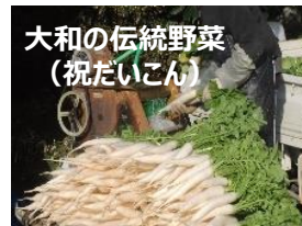
大和の伝統野菜 (祝だいこん)