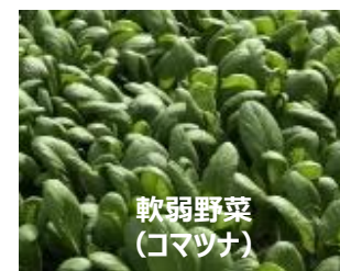
軟弱野菜 (コマツナ)