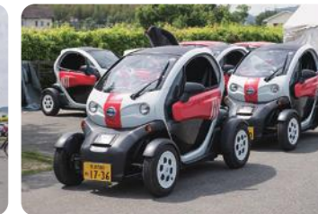
二人乗り電気自動車 MICHIMO