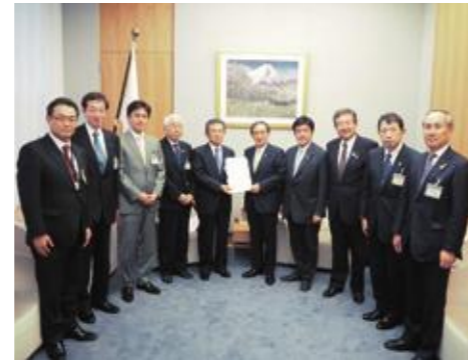
要望活動(2016年11月 於東京都内)

2018年 1月/政府等に対して要望活動を実施(7回目) 4月/大和北道路(奈良北～奈良)新規事業化・有料道路事業導入 5月/神戸西バイパス 有料道路事業導入 7月/西伸部 直轄港湾事業導入