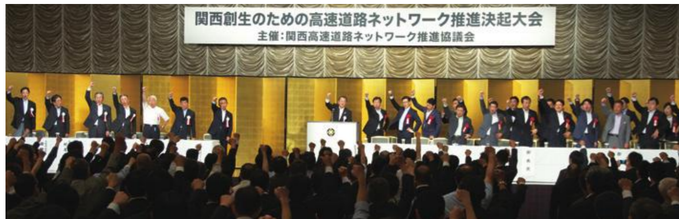
関西創生のための高速道路ネットワーク推進決起大会(2015年6月 於東京都内)