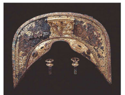
藤ノ木古墳出土鞍金具