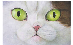
町田尚子「ネコツメのよる」