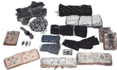
くらしから読み解く明治150年 [大和新聞関係資料]