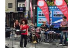
※イメージ まちかどコンサート