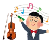
人気の指揮者体験