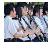
※イメージ あおぞら吹奏楽