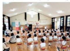
※イメージ アウトリーチ公演