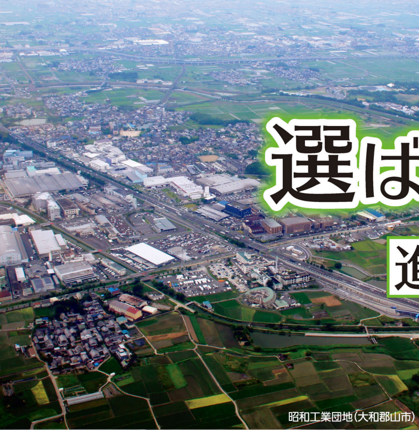
昭和工業団地(大和郡山市)

奈良県は、地理的特性や豊富な人材、企業へのサポート制度などで、「選ばれる奈良」を目指しています。