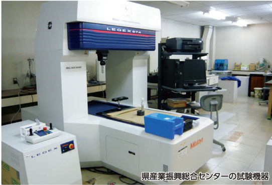
県産業振興総合センターの試験機器

県では、ものづくり企業の製品開発や品質向上の支援を県産業振興総合センターなどで行っています。