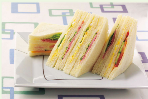
サンドイッチなどの製品は山崎製パンの上質なパンを使い、最先端の技術で製造しています。

現在は一日に3万5千食ほど製造していますが、今後さらに県内の方を積極的に採用し、もっと事業を拡大したいと考えています。