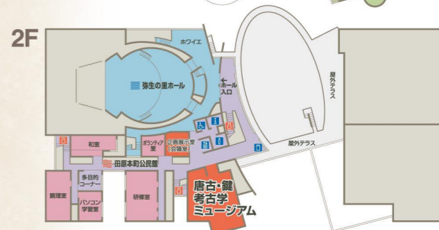
田原本青垣生涯学習センター施設案内図