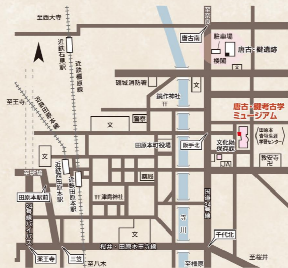
◎近鉄田原本駅より徒歩20分