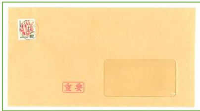
図1 送付されている封書見本

【事例】『重要』と書かれた封書で、『訴訟最終告知のお知らせ』という書面が届いた。書面には氏名と携帯電話番号の記載があり、契約不履行により、身辺調査の開始および訴状の提出がされたとのことだ。連絡するよう書いてあり、取り下げ最終期日の記載もある。差出人に心当たりはない。架空請求として無視してよいだろうか。