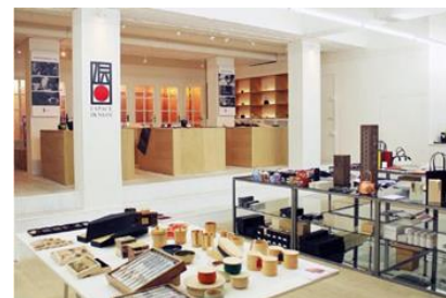
フランス国内のセレクトショップ 展示イメージ