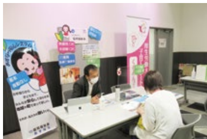
女性のための再就職応援フェスタ