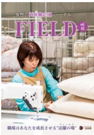
女性の再就職応援ジャーナル「FIELD」

「あまり知られていない良い企業」がたくさんある奈良。知られざる県内企業・事業所の魅力を発信しています。