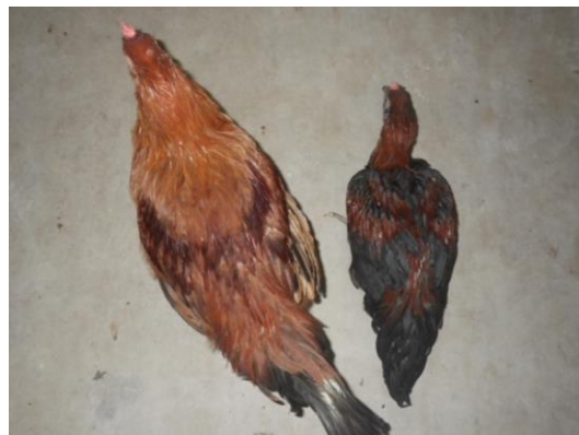
写真 1. 13 週齢 雄 (左:試験区、右:対照区)