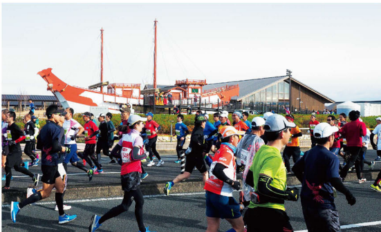
平城宮跡歴史公園の前を走るランナー