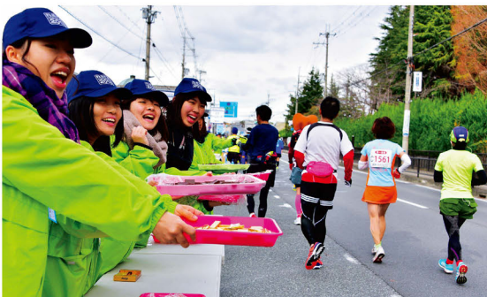
沿道でランナーを支えるボランティアのみなさん