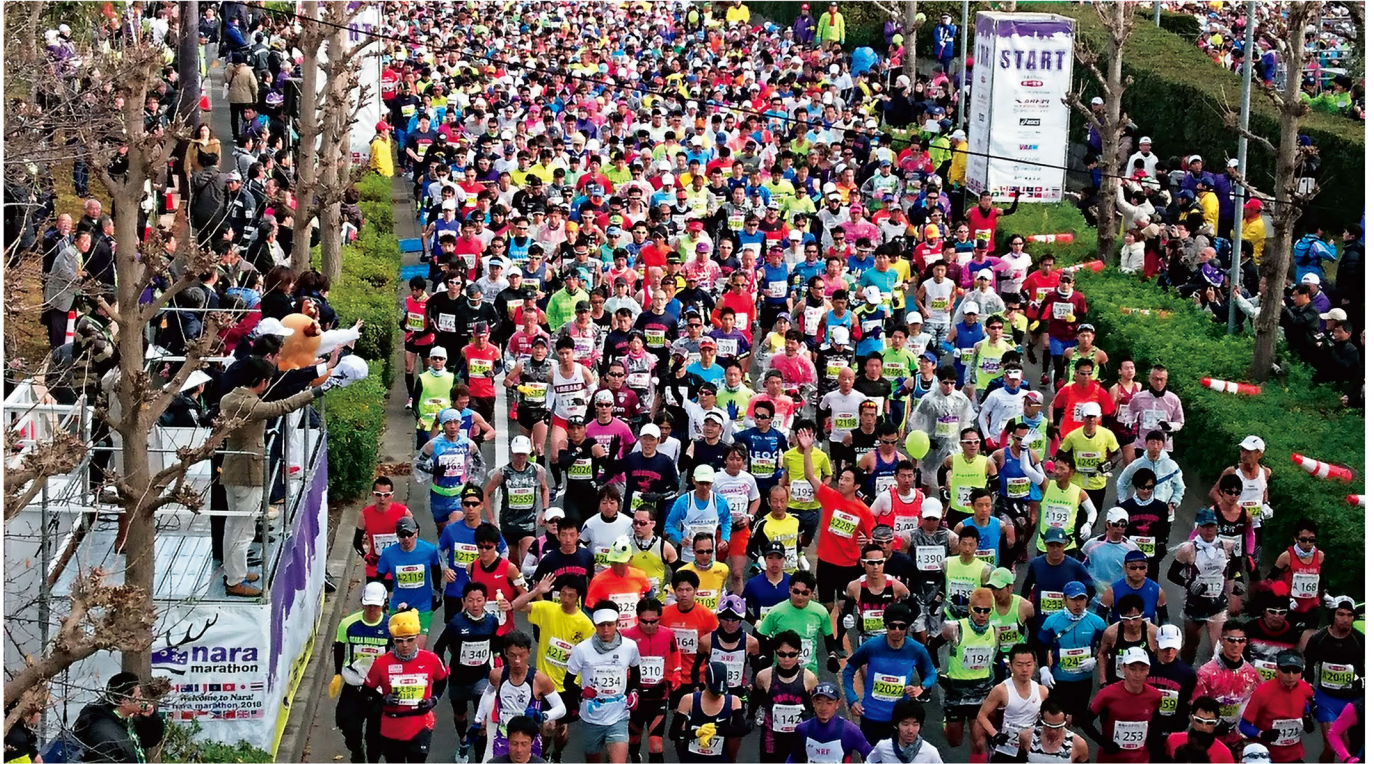
荒井知事の号砲でスタートしたフルマラソン

県のホームページでは、「 こちら知事室です 」で、定例記者会見のようすや県政の考え方も掲載しています。また、「 奈良県フォトニュース 」で県内のニュース等を写真と記事でお伝えしています。ぜひご覧ください。