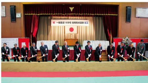
関係者による鍬入れの様子

救急医療施設への安全で迅速な搬送のほか、豊富な観光資源を生かした地域の活性化など、大きな効果が期待されます。