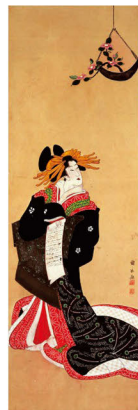
歌川国長 「椿と花魁図」 江戸時代(19世紀) 奈良県立美術館蔵