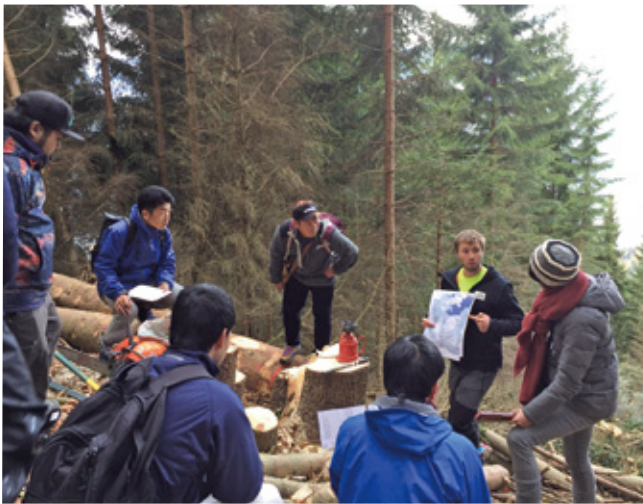
県・市町村職員による森林環境管理の現地研修(スイス)