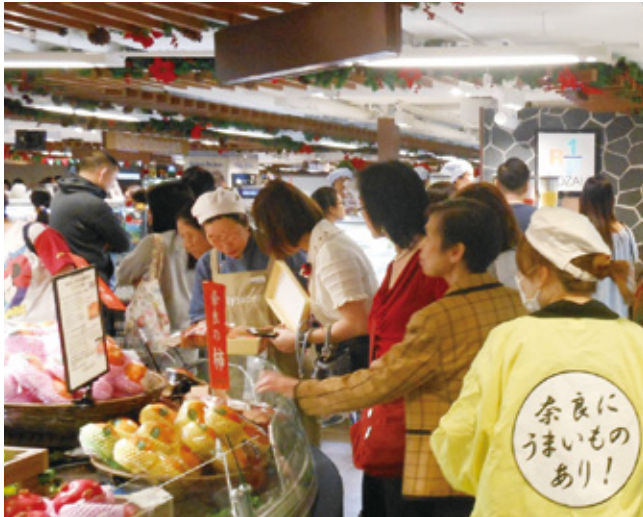
海外高級スーパーでのプロモーション(香港)