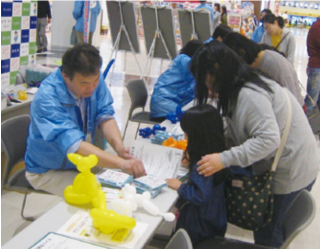
地方消費税啓発イベント(大和郡山市)